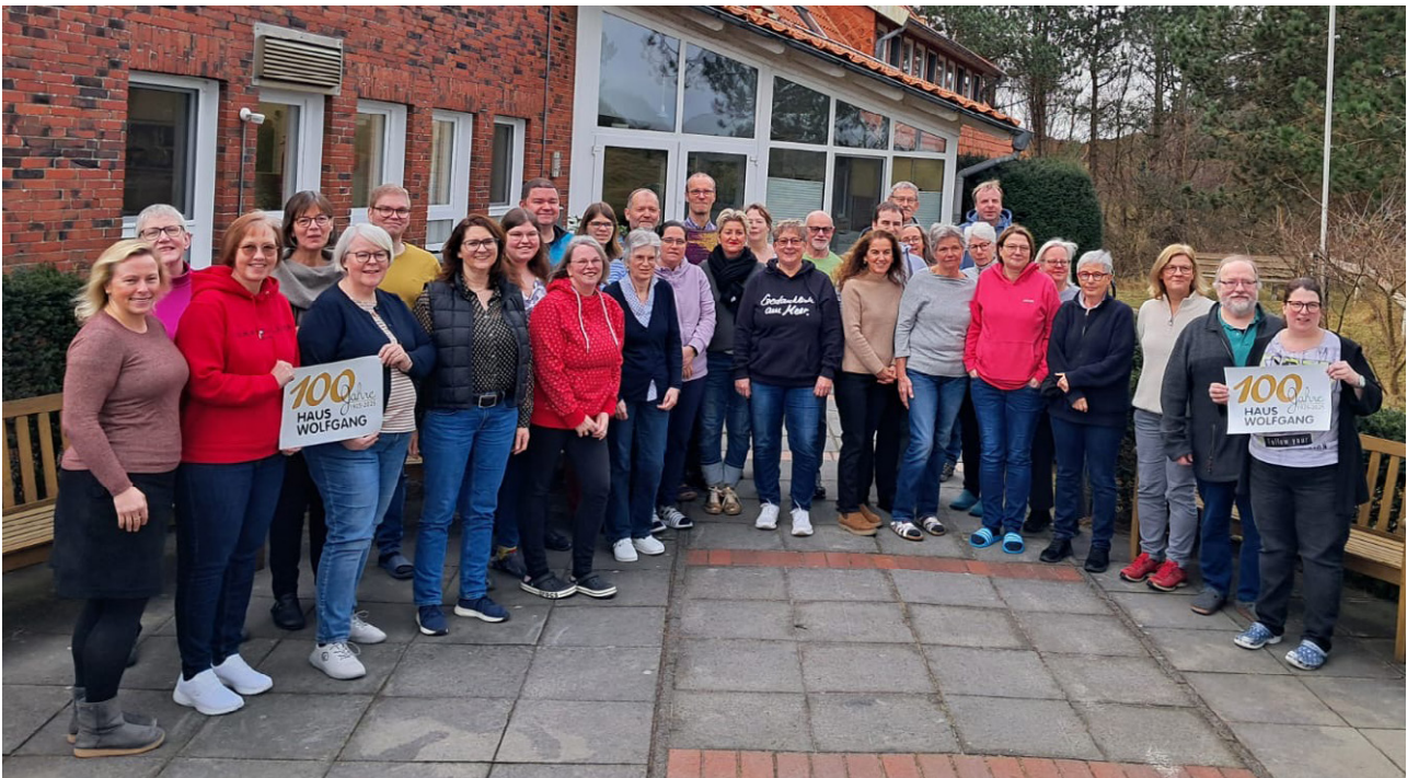
Freizeitleitertreffen im Februar 2025 auf Spiekeroog

Aber gerade aufgrund der Vielfältigkeit der Angebote lohnt es sich, immer wieder mitzufahren. Seien Sie gespannt und bleiben Sie neugierig – wie wir Freizeitleiterinnen und Freizeitleiter auch. Wir freuen uns darauf, Sie kennenzulernen!